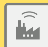
ГУДКИ ПРЕДПРИЯТИЙ И ТРАНСПОРТНЫХ СРЕДСТВ